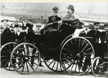
本茨夫妇在奔驰汽车上 摄于1894年