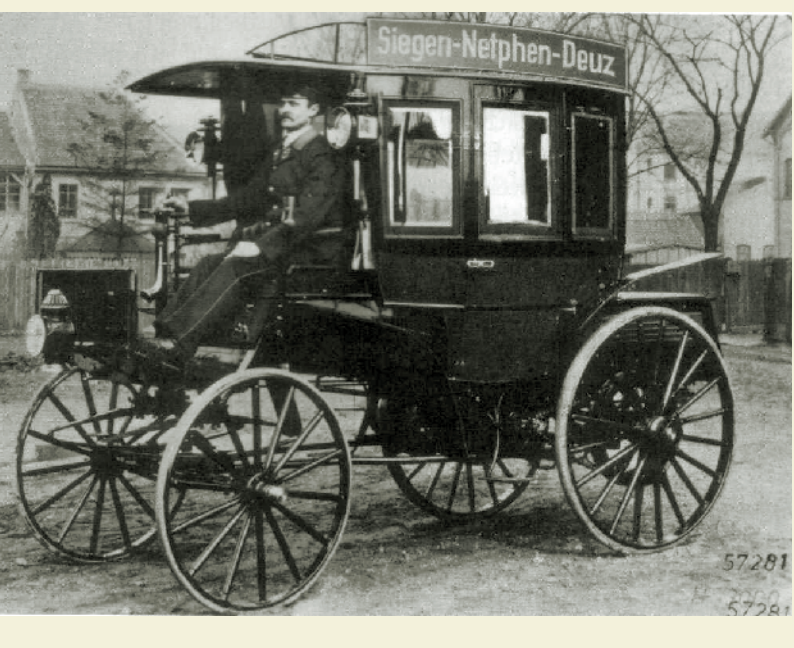
世界第一辆公共汽车