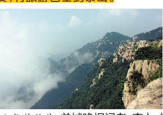
泰山气势雄伟