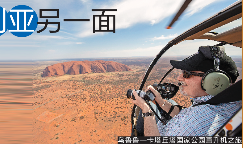
乌鲁鲁—卡塔丘塔国家公园直升机之旅

近日,澳大利亚北领地旅游局在北京、广州、上海三地举办媒体分享会,推荐北领地经典旅游产品,并邀中国游客前往北领地,探索澳大利亚真正的广袤内陆。日前,《孤独星球》杂志“2019最佳旅行目的地”榜单揭晓,澳大利亚北领地红土中心被评为“十大最佳旅行地区”第四位,让这个神秘的地方走进大众视野。