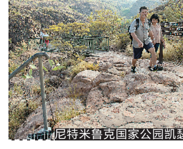
尼特米鲁克国家公园凯瑟琳峡谷徒步

凯瑟琳是北领地的第三大城市,它位于凯瑟琳河畔,澳大利亚内陆正是从这里跨入了热带。凯瑟琳是通往尼特米鲁克国家公园的大门,这座公园建立于1989年,由崎岖的地貌、壮观的瀑布和郁郁葱葱的峡谷组成,因壮观的尼特米鲁克峡谷而美名远扬。乘坐独木舟在尼特米鲁克峡谷中漂流,或是乘坐直升机沿着峡谷飞行,都能从不同角度感受峡谷中欣欣向荣的自然景致。徒步爱好者则可以选择各种长度和难度的远足小径,饱览尼特米鲁克峡谷的壮观景象。