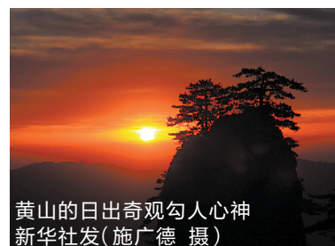
黄山的日出奇观勾人心神

俗话说,“五岳归来不看山,黄山归来不看岳”,这是对黄山最好的诠释。黄山位于安徽省南部黄山市境内,有中华第一奇山美誉,它是世界文化与自然双重遗产、世界地质公园。黄山有72峰,主峰莲花峰海拔1864米,与光明顶、天都峰并称三大黄山主峰,为三十六大峰之一。