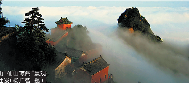
武当山“仙山琼阁”景观

武当山从山脚下到山巅天柱峰金殿,约数十里长的蜿蜒山道两旁修建了9宫、9观、36庵堂、72岩庙、39桥梁、12亭台等庞大的建筑群,蔚为壮观。风景名胜以天柱峰为中心有上、下十八盘等险道及“七十二峰朝大顶”和“金殿叠影”等。规模宏大、气势磅礴的紫霄宫,坐落在武当山展旗峰下,群峰山岭环绕,历来被视为“紫霄峰地”。此外,被誉为“海市蜃楼”的古建筑“太子坡”亦名“复真观”,其背靠狮子山,建筑布局极具特色。南岩宫,即南岩胜境,是武当山36岩中最美的一处。