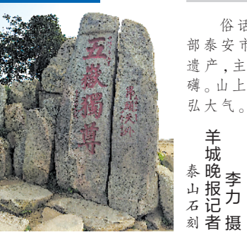
泰山石刻

俗话说,登泰山而小天下。位于山东省中部泰安市的东岳泰山,是世界文化与自然双重遗产,主峰玉皇顶海拔1545米,气势雄伟磅礴。山上历代帝王、文人墨客遗迹甚多,建筑恢弘大气。