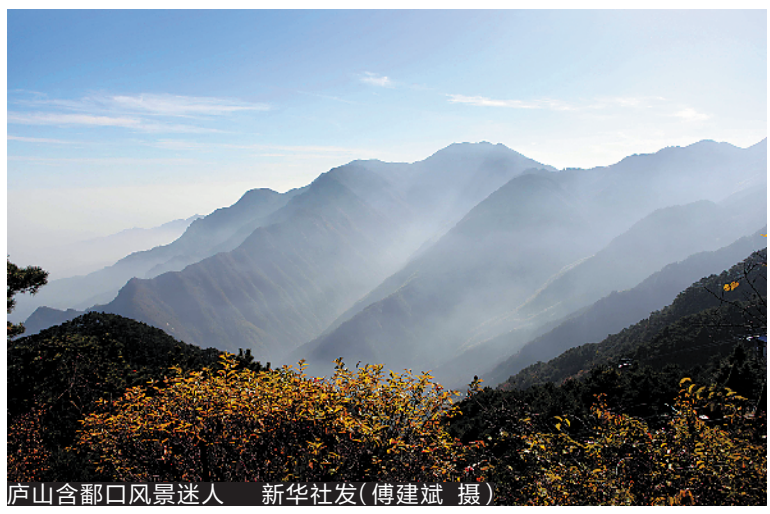
庐山含鄱口风景迷人

主要风景名胜还有五老峰、含鄱口、芦林湖、东林寺、白鹿洞书院等。庐山上还荟萃了各种风格迥异的建筑杰作,包括罗马式与哥特式的教堂、融合东西方艺术形式的拜占庭式建筑,以及日本式建筑等,堪称庐山风景名胜区的精华部分。