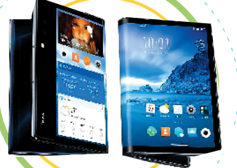
可折叠柔性屏手机

14日,高交会在深圳会展中心正式开幕。羊城晚报记者巡馆发现,本届高交会聚焦科技创新与经济社会的高度融合,一大批高精尖产品和技术纷纷亮相,吸引了不少观众驻足围观。