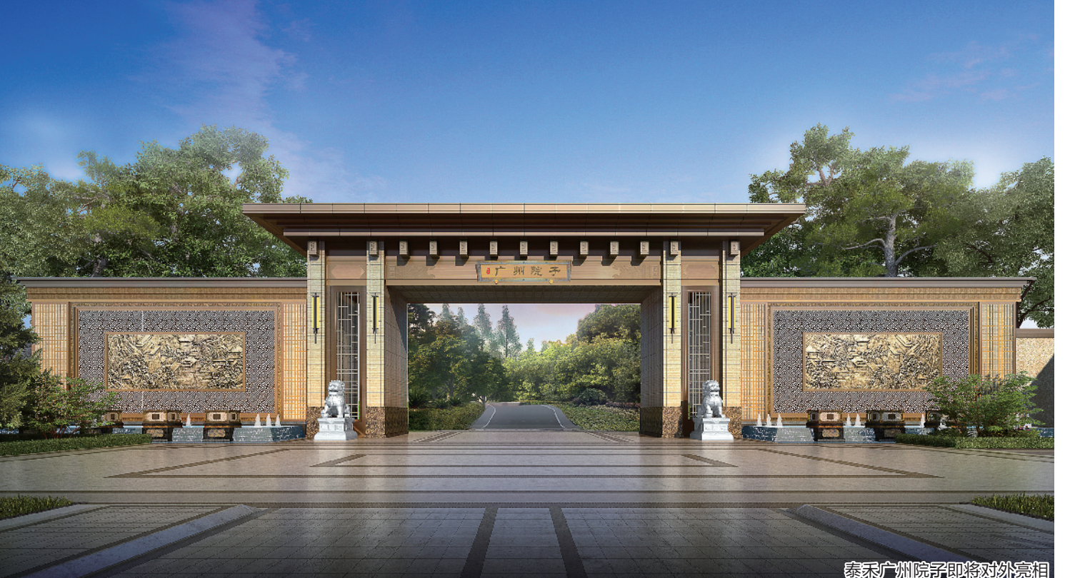
泰禾广州院子即将对外亮相

一座伟大的城市，总会有能代表时代印记的标志性建筑被写进史册。 世纪工程港珠澳大桥的正式通车，让粤港澳大湾区再次成为国际瞩目的焦点。一桥飞架三地，三地民众期盼的“大湾区1小时生活圈”正在逐渐形成，粤港澳大湾区从此获得强劲助推器加速起航。 在大湾区的大建设中，广州，毫无疑问承担起粤港澳大湾区核心增长极、国家科技创新中心、枢纽型网络城市及国际交往中心的角色，而这个角色，也赋予这个城市及众多产业更多更高的价值，科技产业不例外，房地产业也不例外，这也是众多实力型过江龙房企纷纷进军广州楼市的根本原因。去年，闽系房企泰禾集团来了，今年四季度，它将以经典立碑之作院子系产品“广州院子”打开广州市场，用泰禾的话说，这是“一座湾区的院子大城”。 (文/陈玉霞)