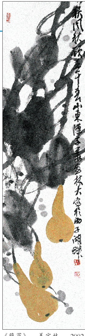
《葫芦》 姜宝林 2012

如今风景区这么做，无疑是在鼓励游客随意“涂鸦”，给这种本该杜绝的不文明行为开了一个光明正大的“借口”，无形之中纵容了这些恶习。 其二，竹林和字孰更美？刻字林开放仅有两天，就已经有一百多根竹子被刻上了字。区区几个字也许不足挂齿，但可曾想过这么做已是在对竹子本身进行破坏？现在我们已经要面对生态问题，就包括在自然生态保护区内，常常会出现有人乱扔垃圾、随地大小便、折摘植物等现象。景区是否在这些方面有所应对，我们无从考究，但相比那些刻上的字，景区更应该爱惜这片竹林，保护好这里的生态系统，而不是为了商业利益，就放任它被摧残至面目全非。 其三，竹林之“字”真的美吗？竹林“涂鸦区”是自由活动区域，对任何游客都开放，所以在刻字的内容上，景区无法严格控制。因此有竹子被刻上一些不文明内容，景区也无奈何。回忆一下以前我们见过的公厕里那些大字、各种铁门上被贴上的小广告，其实和这个并无区别，都令人厌恶。景区不可能每日对几百根竹子进行排查，这样工作量太大。但若外国游客来此地游玩，这片“风景”无疑会成为一张体现着中国人风貌的名片。这些是景区有责任考虑到并进行提前扼制的。 归根结底，景区实行“涂鸦区”是有不周全之处的。“刻字林”确实是一个极大的卖点，吸引了众多游客前来。但景区在考虑创新之前应该全面思考，首先还是要推崇社会文明与正确的价值观，这样景区才会愈发美丽。同时，旅游文明是全社会的责任，需要每个人的参与，这样才能营造更美好的旅游大环境。我们拒绝“一字成灾”。