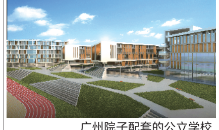
广州院子配套的公立学校

2017年7月份，泰禾发布公告称以42.5亿元收购增城4宗宅地，正式进军广州。这样的举动，在业内看来并不奇怪，此前，泰禾集团董事长黄其森就曾多次提及布局一线城市的坚定目标。这一次重量级收购，正式圆了泰禾全面布局四大一线城市之梦，也足以证明广州这座千年文化大城及国际一线大城在泰禾版图中的重要地位。 11月中旬，由全球化与世界城市(GaWC)研究网络编制的全球城市分级排名——《世界城市名册2018》正式出炉。这份榜单被认为是全球最权威的世界城市排名之一。它通过检验城市间金融、专业、创新知识流情况，确定一座城市在世界城市网络中的位置，并对城市进行Alpha、Beta、Gamma和Sufficiency(+/-)划分。在2016年的榜单中，广州首次达到Alpha-级，跻身世界一线城市行列。而在今年的榜单中，广州再升一级，从Alpha- 晋升至Alpha级别。 作为一个坚持“文化筑居中国”的房企，泰禾但凡进入一个城市，其表现出来的就是对这座城市、这片土地的尊重，因此才有了一个又一个市场代表作。院子系是其中拳头产品之一，以北京的中国院子为例，该项目连续4年获得“亚洲十大超级豪宅”称号，同时也获得了“中国建筑传承大奖”，被业内视为国宅典范。该项目颇具新中式韵味的独栋，开创了中国特色独栋精装院落交付的