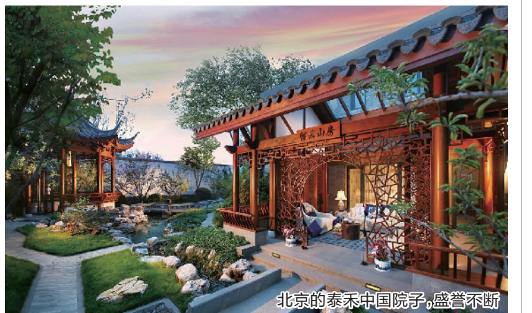
北京的泰禾中国院子，盛誉不断