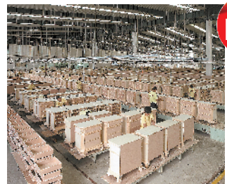
规模化的生产车间

三十多年间,一间用800元“原始资金”起家的木棚家具作坊,一步步成长为一家总资产800多亿元的大型跨国企业,广东宜华集团用自己的创业史,给改革开放40年辉煌历程中民营企业砥砺奋进之路作出了完美的诠释。