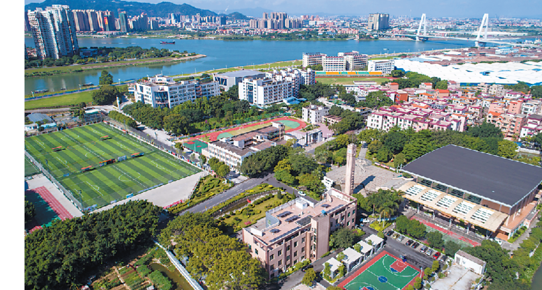
乡村振兴大潮中,南庄将迈入吉利河时代