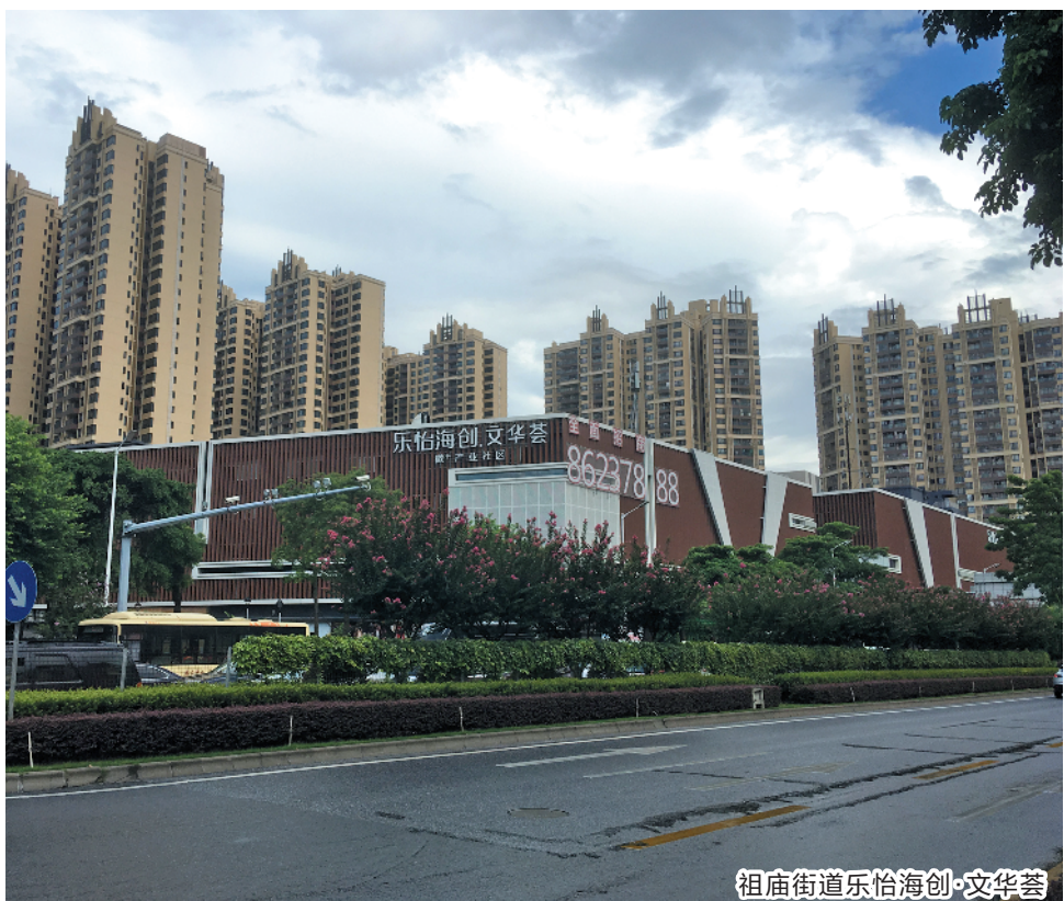
祖庙街道乐怡海创·文华荟