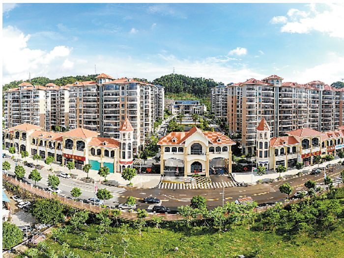
凤岗不断强化基层治理，增进民生福祉

究部署工作；坚持高压打击，目前，全镇收到有效线索 137 条，上报市 32 条，打掉恶势力犯罪团伙 13 个，1 至 9 月，镇公安工作综合成效全市排名第一。