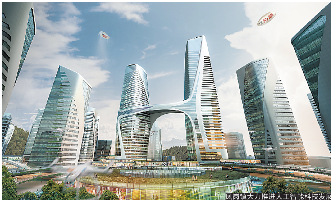
凤岗镇大力推进人工智能科技发展

数据显示，今年前三季度，全镇实现生产总值 206.6 亿元，增长 5%；规模以上工业总产值 412.2 亿元，增长 8.7%；固定资产投资增长 54.3%，增速全市排名第一。今年，东莞凤岗镇委书记张耀洪在凤岗镇党委中心组组织专题学习会上多次强调，凤岗镇必须始终坚持全面深化改革开放不懈怠，充分利用凤岗经济基础较好的优势，不断探索构建现代化经济体系。