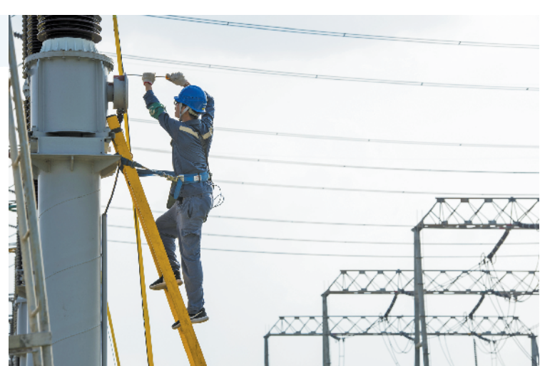
东莞供电局试验研究所班员为500千伏东惠乙线开关、CVT、避雷器进行周期性“体检”

据电力调度控制中心运行方式分部相关负责人黄安平介绍,作为电网的“最强大脑”,调度部门通过提前深度参与前期规划审查,有效减少了重复停电次数,大大缩短了停电时间,进一步提高供电可靠性。哪些供电设施要优先建设?电网结构如何优化?停电影响如何降到最低?电力调度控制中心会给出专业分析和建议。黄安平说:“以110千伏卢溪变电站全停开展主网基建工程为例,该中心通过统筹主配网基建工程、技改、修理项目及主网预试定检计划,最大化优化停电计划,做到一次停电多项配合,提高工作效率。通过转供电、发电车保供电、带电作业等解决措施,该变电站全停最终只产生停电约0.0003小时,减少了客户平均停电时间,提高了供电可靠性。”