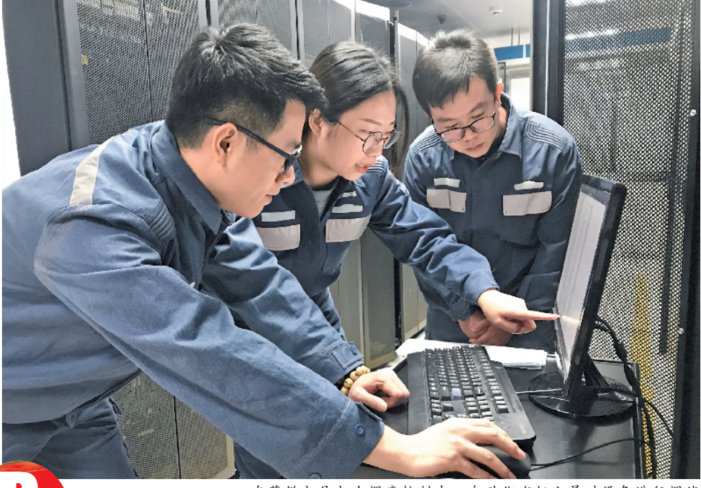
东莞供电局电力调度控制中心自动化班人员对设备进行调试

南方电网广东东莞供电局从改善电网架构着手,从设备源头和管理本质上,持续提高供电可靠性。2018年上半年全国主要城市用户供电可靠性指标发布,东莞市在全国52个主要城市中位居第二,平均供电可靠率达到了99.986%。