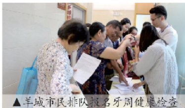
▲羊城市民排队报名牙周健康检查

全国口腔健康流行病学调查显示：44 岁-74 岁人群，超过一半患有牙周病。临床数据证明 76% 以上的成人缺牙，罪魁祸首就是牙周病。为此，羊城“高龄多颗种牙特诊”专项举办“牙周健康专项检查”活动，旨在帮助市民检查评估牙周健康、科学防治牙周病，并针对多牙缺失市民开展专项补贴：底价进口种植体 2980 元 / 颗，半口全口种牙半价补贴，报名电话 020-8988 8807。