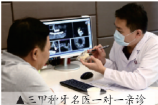
▲三甲种牙名医一对一亲诊