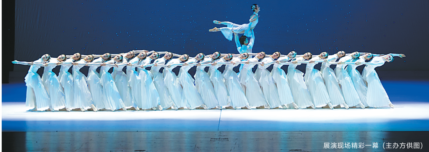
展演现场精彩一幕

羊城晚报讯 记者黄由辉、通讯员广芭宣报道:25日,广州芭蕾舞团(以下简称“广芭”)迎来25周岁的生日。25日、26日,中央芭蕾舞团、辽宁芭蕾舞团、天津芭蕾舞团、苏州芭蕾舞团、北京当代芭蕾舞团、兰州芭蕾舞团和广芭等各大国内顶尖芭蕾舞团首次云集羊城,在广州大剧院为观众带来了一场芭蕾盛宴。