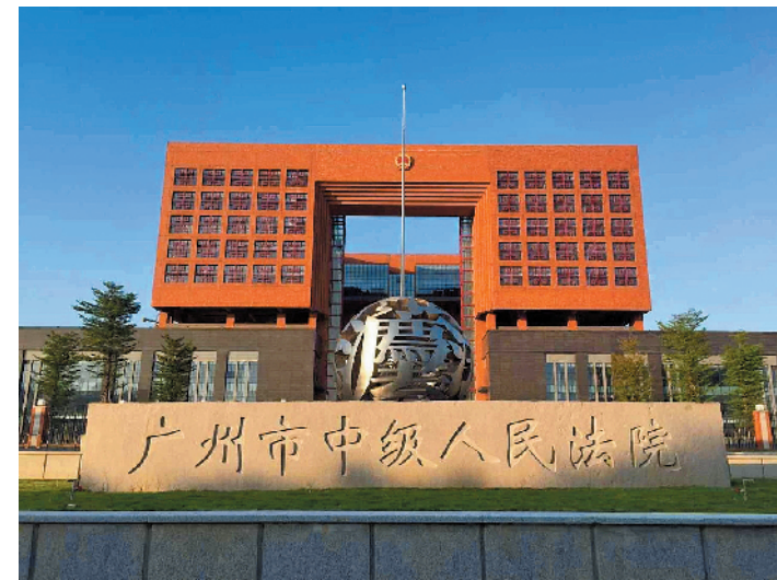
明年元旦起,广州中院正式启用新审判大楼

羊城晚报讯 记者董柳摄影报道:广州市中级人民法院26日发布关于启用新审判业务大楼的公告: