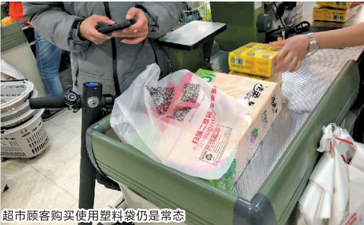
超市顾客购买使用塑料袋仍是常态