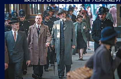
波洛与克罗姆警官（左二）建立起信任