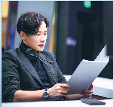
罗晋饰演资深制作人淳于乔

像过日子一样，我也不知不觉地接受挑战。” 随着日渐走红，周冬雨的着装搭配也成了网友们效仿的对象。她坦言：“我挺爱美的，也希望跟大家交流一下时尚方面的经验。我的衣服并不一定是特别贵的，为什么大家会觉得我的穿着越来越好？我想可能是因为我跟大家一样，也是从一开始不了解自己，到越来越了解自己；还有就是因为我跟大家一样，没有很美丽的长相，反而更容易有认同感。”