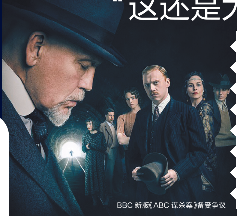
BBC新版《ABC谋杀案》备受争议

“阿加莎·克里斯蒂的棺材板要压不住了！”在2015年的《无人生还》、2016年的《控方证人》、2018年的《无妄之灾》之后，BBC再度将阿加莎·克里斯蒂的小说搬上荧屏——这次轮到阿加莎·克里斯蒂的经典案件《ABC谋杀案》，没想到，恶评却来得更加猛烈。