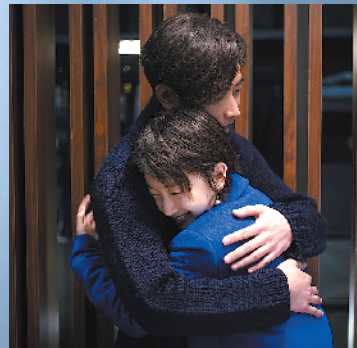
布小谷与淳于乔渐生情愫