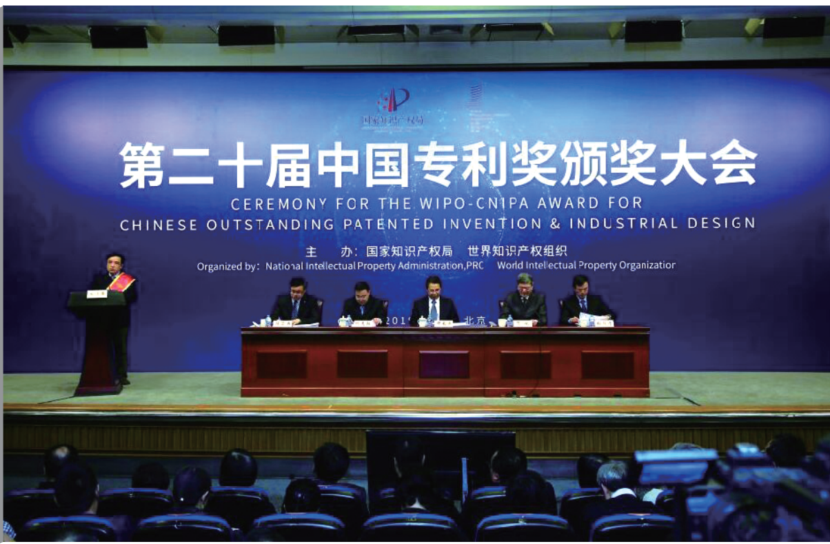
第二届中国专利奖颁奖大会在北京隆重举行

日前，由国家知识产权局与世界知识产权组织共同举办的第二届中国专利奖颁奖大会在北京举行。白云山制药总厂发明的名为“一种枸橼酸西地那非片剂及其制备方法”(ZL 201510134423.7)的专利荣获第二届中国专利奖优秀奖，成为国产抗 ED 药中的耀眼明星。 作为首个国产“伟哥”，白云山金戈坚持用自主知识产权及切实疗效说话。经过严格的药物临床实验、上市后再评价及生物等效性研究，金戈被证实与原研产品等效。此次获得专利奖殊荣，也再次凸显了白云山金戈在工艺、制剂、包装、视觉形象等知识产权管理的标杆形象。