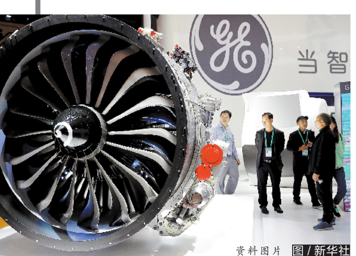
资料图片 图/新华社

赵明:大概海外市场的全年销量增长率肯定超过150%,翻了好几番。就海外占比而言,应该可以达到20%-30%,增长非常大。到2020年,荣耀在国内市场