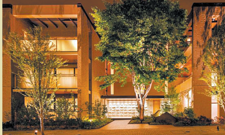
日本的高级住宅区

凡是到过日本的朋友,一定有一个感觉,那就是日本的城市很干净,干净的不只是街道,还有房子,看上去那么一尘不染。你看日本的建筑,很难看出它的年份,因为10年前造的房子和30年前建造的房子,从外表上看,都是差不多,跟新的一样。为什么日本能够做到这一点,秘密只有一个,那就是日本人恪守建筑物的维修保养之道。