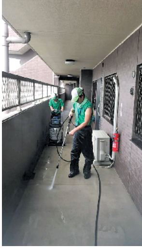
物业公司派人上门清扫楼道

那么,怎样保证整栋大楼能够维持长期的,而且又是经常性的维修呢?日本有一项法定的制度,那就是买了公寓楼的房子,就要缴纳维修基金。维修基金的缴纳,是每一位拥有房产的人必须承担的义务,而且这一义务是依据“平等均分”的原则实施的。首先,在购买新房时,你必须缴纳一笔维修基金,一般3室1厅的房子,第一次需要缴纳大约150万日元,也就是10万元人民币左右。然后,每个月再缴纳相当于1000元