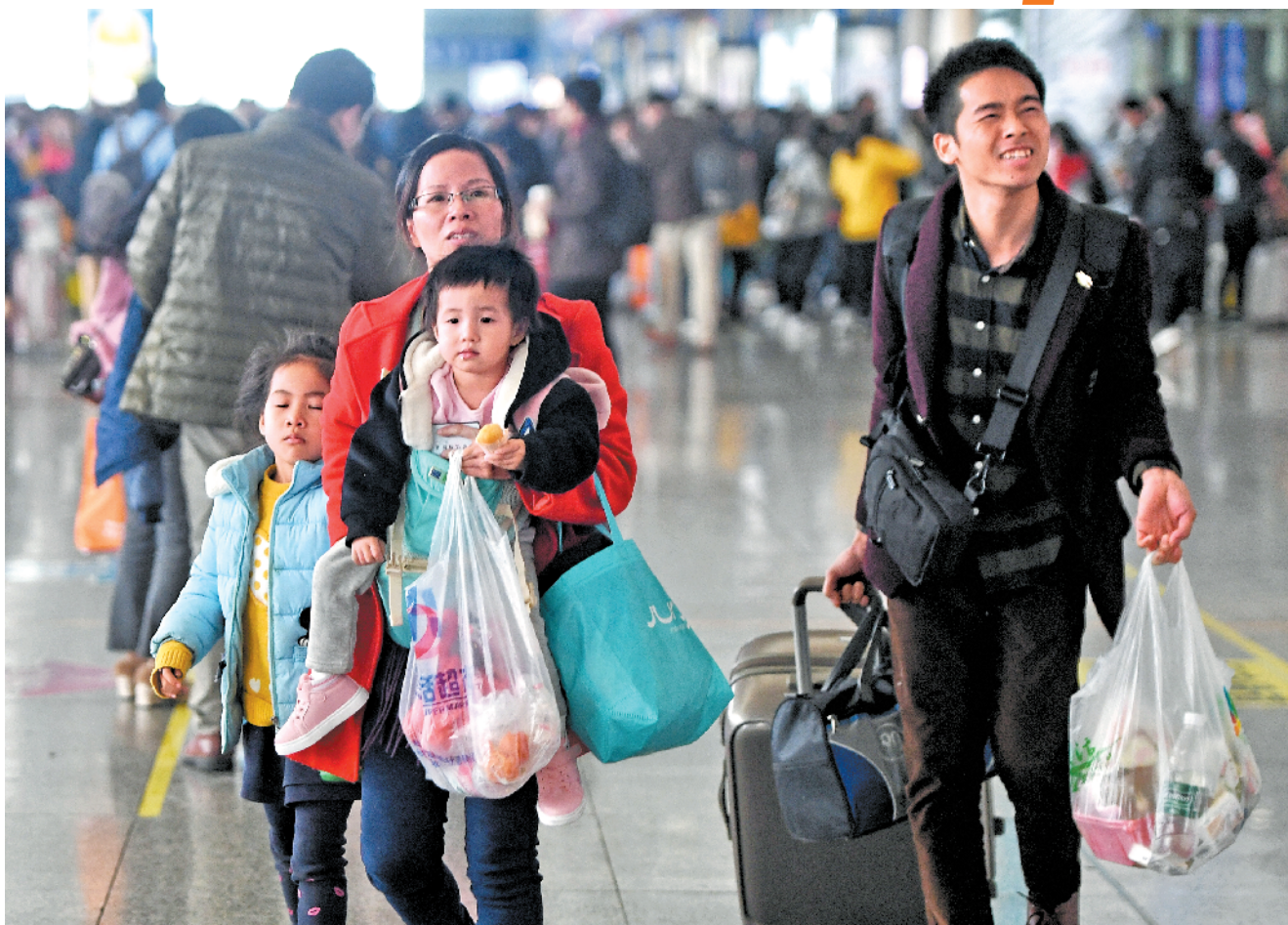
2019年1月21日，春运首日，广州南站迎来大批回家过年的旅客。