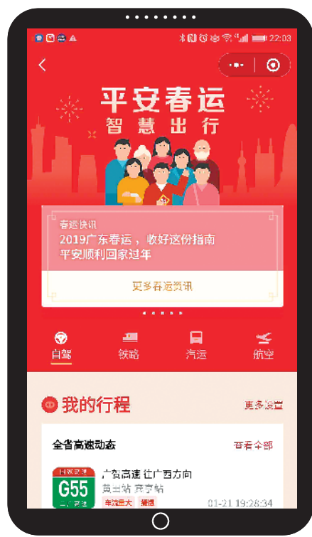
粤省事·春运服务专区

值得一提的是，今年春运期间出现类似2008年持续性低温雨雪冰冻灾害和2016年强寒潮事件的可能性很小，琼州海峡出现去冬春运期间持续大雾现象的可能性也比较低；但粤北高寒山区路段可能出现短时间的冰冻，沿海海面、广东省江河流域仍会出现小范围短历时的大雾。