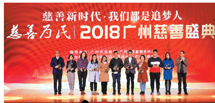
2018广州慈善盛典现场

羊城晚报讯 记者符畅、通讯员廖培金报道:1月21日,由广州市民政局、广州市慈善服务中心指导,广州市慈善会、广州市公益慈善联合会共同主办的2018年度“慈善为民”广州慈善盛典在广州图书馆举办。现场正式发布了《广州公益慈善事业发展报告(2018)》,揭晓了2018年度广州慈善标志,并表彰了2018年度广州慈善榜。其中,羊城晚报荣登“广州慈善文化传播影响力榜”,由羊城晚报报业集团发起的“共建共享 和谐广东”文化大篷车社区行项目登上“广州慈善项目影响力榜”。