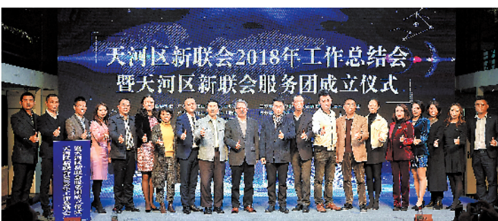
天河区新联会2018年工作总会暨天河区新联会服务团成立仪式

广州市委统战部副部长、市社会主义学院党组书记马卫平表示,天河区是我市的经济强区,是国内最具活力的互联网产业、文化创意产业、高科技产业集聚区,一大批新的社会阶层人士扎根天河,统战资源丰富,优势特点鲜明、天河区区委区政府一直高度重视新的社会阶层人士工作,天河区新联会是广州市第一个成立的区级新联会,天河区区委统战部秉承着敢为人先的精神,凝心聚力,开拓创新,砥砺前行,在全市新的社会阶层人士统战工作中一