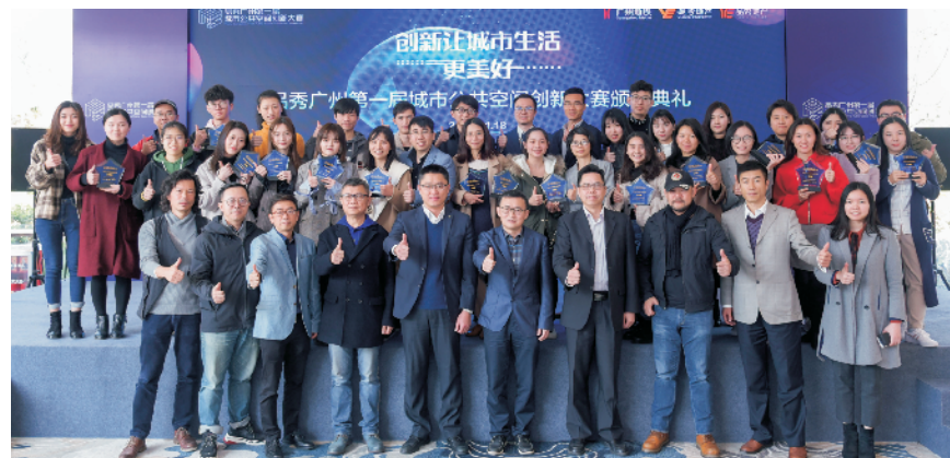
品秀广州第一届城市公共空间创新大赛颁奖典礼圆满成功

大赛历经半年多时间,举办了一系列丰富多彩的创新主题活动,最大化地调动了公众参与性,将创新意识深深扎根在每一个人的心中。2018年9月份,大赛在广州美术学院、华南师范大学等多间高校展开创新主题宣讲,获得了高校师生的热烈参与及踊跃报名,影响力辐射十多万大学生;同月,大赛发起“创新带给城市的小确幸”名人工作坊,邀请华南理工大学何志森老师进行主题分享。10月份,切合零门槛的办赛宗旨,大赛在广州地铁博物馆举办了“动手趣创新”系列体验工坊,让小朋友自己动手去体会创新的乐趣,为城市创新培养新生力量。11月份,大赛举办PK晋级赛,多