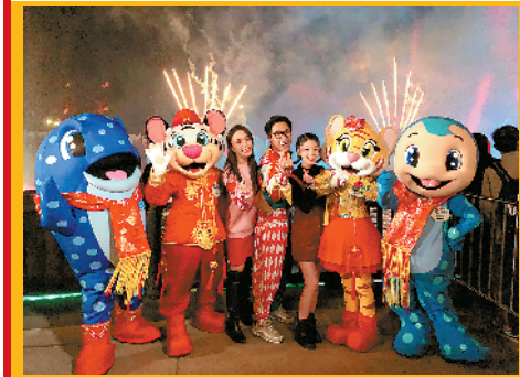
俊男美女外景迎猪年