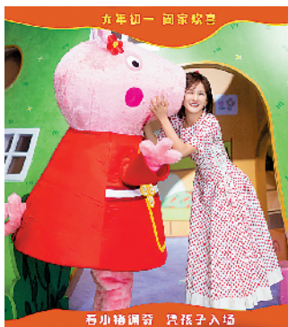
谢娜献唱《小猪佩奇过大年》主题曲