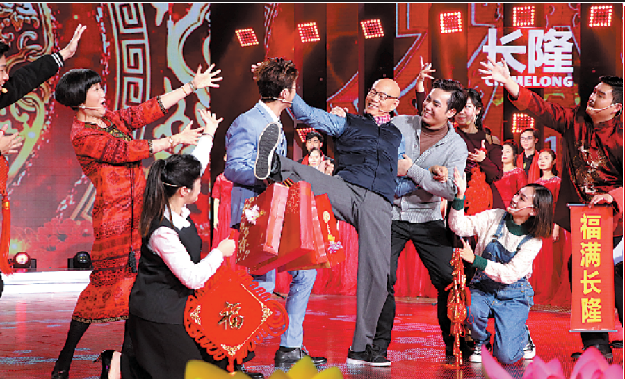
罗家英(中)携合唱团上演《追梦赤子心》

相声、小品、歌舞剧等语言类节目,是历年春晚的收视法宝,2019 除夕晚会的语言类节目侧重通过谐趣逗乐的语言或歌舞,歌颂真善美,弘扬正能量。羊城笑星黄俊英、何宝文的相声《妙语连猪》,带大家感受粤语文化的魅力;小品《外来媳妇本地郎之“智能社区”》中,听说老作要带领昌盛街的街坊开启“人