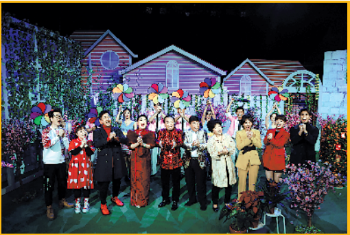
粤港两大家庭其乐融融