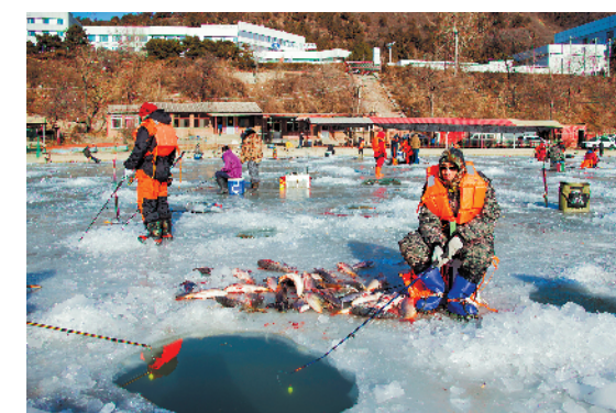
▲北京昌平的一些商业鱼塘，也会开拓冰钓业务，吸引不少冰钓爱好者。

▲对于很多美国人来说，冰钓是一种很普通的休闲方式，一边钓鱼一边上网、看书或与朋友聊天，是一种冬日里的最佳享受。