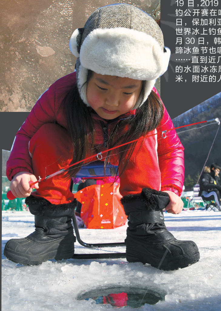
▲韩国华川鳟鱼庆典上凿冰钓鱼的小朋友