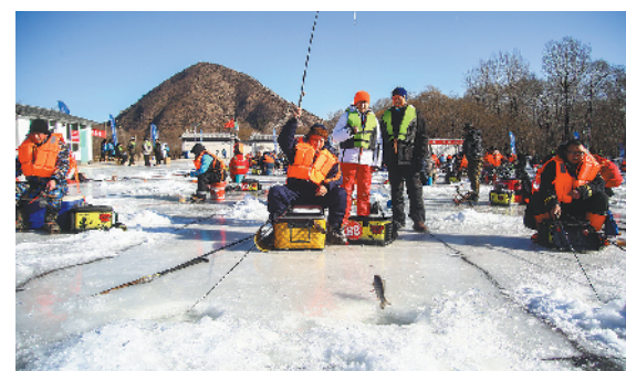
▲在今年举行的第二届迎冬奥·京津冀冰钓联谊赛上，有国家资质的裁判员执裁。据说为推动冰钓运动的开展，该赛事还有个“逐步实现三亿人参与冰雪运动”的战略目标。