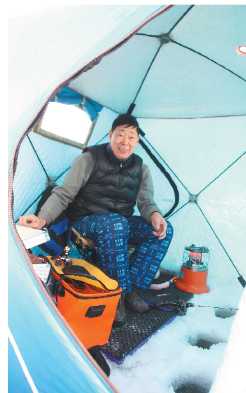
▲黑龙江省大众冰钓公开赛已成为当地冰雪体育传统赛事之一，今年又有100余名选手参赛。这位选手坐在帐篷里，面对着3个冰洞开始奋战。据说不限饵料，不限制钓法，只以规定时间内钓到鱼的总重量来计算成绩。

▲对于很多美国人来说，冰钓是一种很普通的休闲方式，一边钓鱼一边上网、看书或与朋友聊天，是一种冬日里的最佳享受。