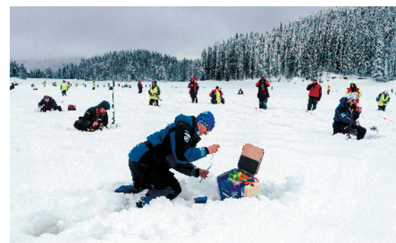
▲1月底，保加利亚巴塔克举行的第十六届世界冰上钓鱼锦标赛上，来自世界各地的冰钓专业人士齐聚海拔1500米的Shiroka polyana湖，争夺冰钓的“世界冠军”。