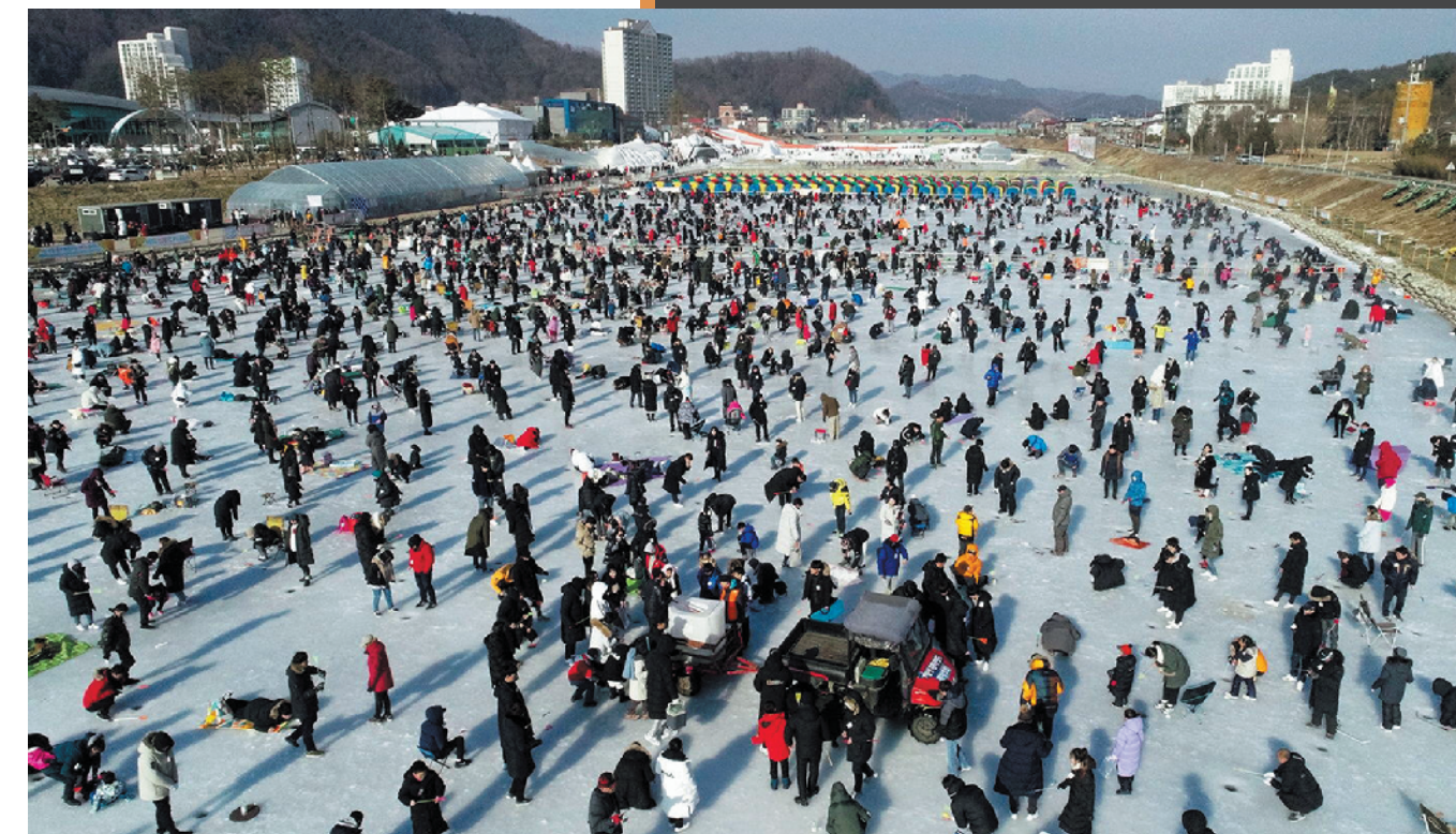
▲1月30日，韩国“第19届麟蹄冰鱼节”上，在昭阳江上游一片广阔冰面上全是密密麻麻冰钓的人。据官方发布的统计数据，此冰鱼节开幕后的第一个周末共接待了4.5万多名访客。

辽宁地区的大河水面上，经常可见到喜欢钓鱼的市民们在享受冰钓的乐趣。这位哥们用干草垫脚，也可以在冰洞前蹲钓大半天。