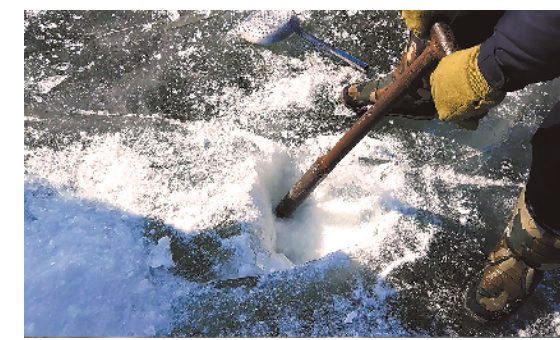
▲厚厚的冰层很坚硬，即便是小汽车行驶在上面也不会有崩裂的危险，但要想在上面凿开一个小洞钓鱼，还真得下不少工夫。