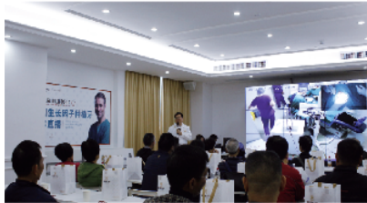
天河院区种牙直播现场

近日，第5届德国种植牙节发布了“德国生长因子种植牙技术”，随之之缺牙市民纷纷电话咨询。为让更多缺牙市民了解新技术，柏德口腔特别举办德国生长因子种植牙手术直播活动，邀请国际口腔种植专家亲诊。据了解，直播活动吸引了大批有种植牙需求的缺牙街坊，一同见证缺牙快速再生。种植牙期间拨打020—38824929预约种牙可享3颗13800元。