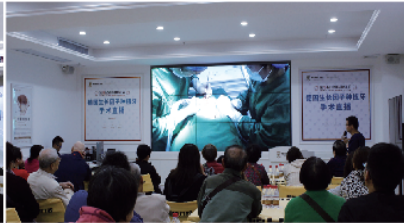
海珠院区种牙直播现场