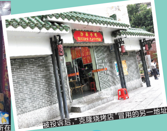
被投诉后，“克隆烧烤店”冒用的另一地址