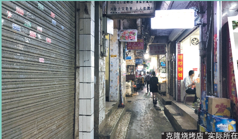
“克隆烧烤店”实际所在

一样的店名、一样的招牌、一样的地址，在不同外卖平台下单，为何味道、服务天差地别，一家货真价实、正常配送，另一家品质极差、配送缓慢？蹊跷现象背后原是“克隆外卖店”作怪。近日，羊城晚报记者收到爆料，称有外卖平台存在“克隆外卖店”。记者调查发现，部分外卖平台对“一证多开”审核的松懈，使“克隆店”有了可乘之机，有店家用同一地址一口气开了五家外卖店。