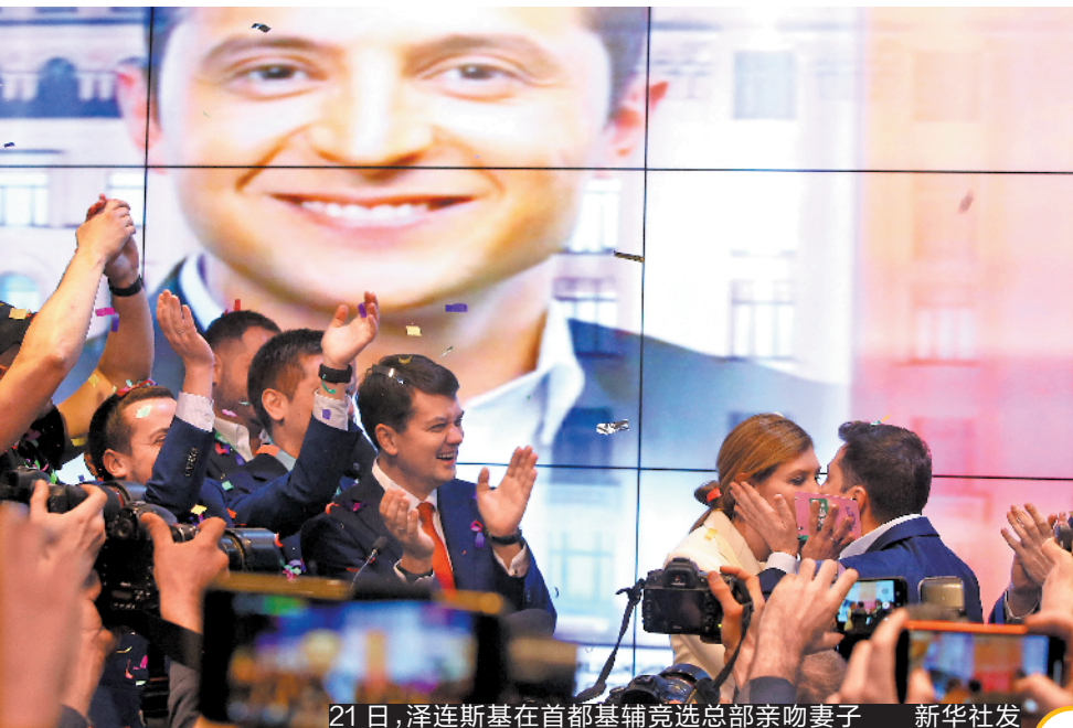
21 日，泽连斯基在首都基辅竞选总部亲吻妻子