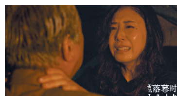
影片最后部分被指过度煽情

世文演得很好,但煽情实在太过火了。”影迷probe说:“当事人自述做出了情境还原式的完全坦白,以此表明罪犯无法抗拒的悲惨背景,让人心生同情,进而消解罪犯的个人因素,甚至作案动机都转换成了伟大的牺牲。”网友“易老邪”则表示:“为维护女儿的生活事业不受影响,就选择杀人灭口,将其他无辜人的生命视如草芥,这不值得认同和煽情。”