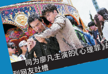
同为廖凡主演的《心理罪》却遭到网友吐槽