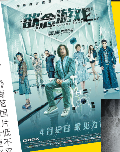
两部正在上映的国产悬疑片票房惨淡