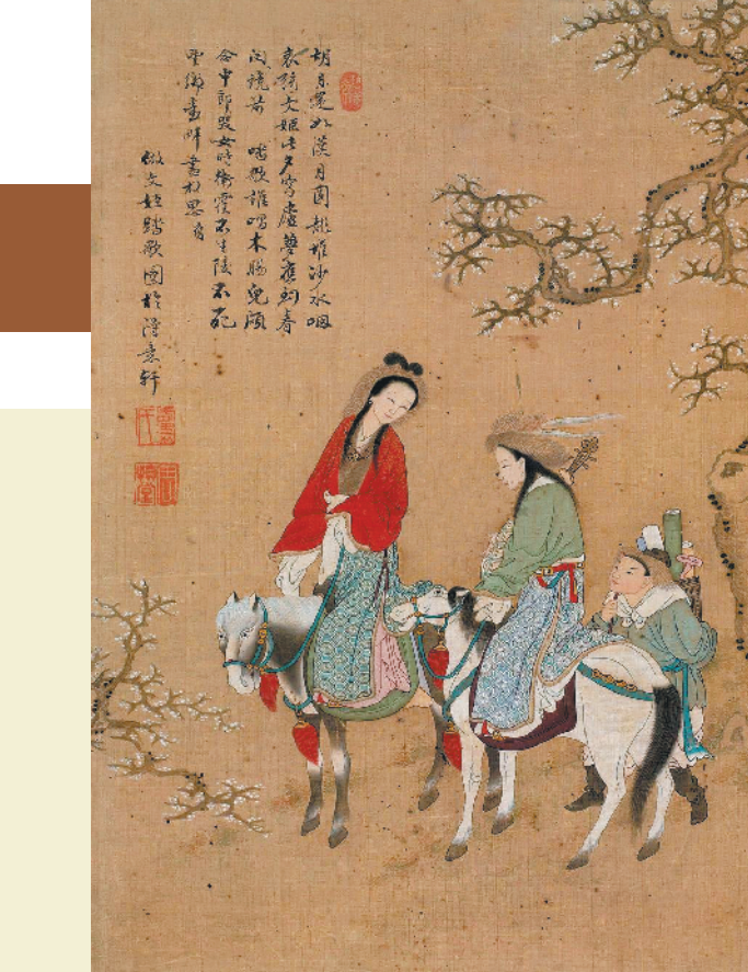
清代画家周慎堂绘《文姬归汉图》(资料图)

人们习惯说脏唐臭汉，大概也是站在这个角度来讲。其实，换一个角度来看，也可以说是婚姻自由，尊重女性，开明包容，反倒是后来者心胸越发狭隘不人道，不把女人当人看，思想观念上比之汉唐宋才是真的脏臭。