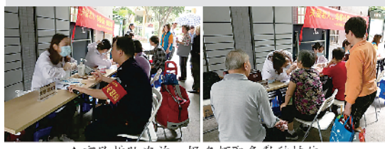
▲市民排队咨询、报名领取免费种植体

怕痛、种牙多费用大是高龄老人种牙的两大“拦路虎”!据调查显示:55岁以上种牙患者中,超过80%的患者或多或少会担心疼痛,在60-80岁缺牙人群中,半口、全口缺牙者占比高达60%!为了帮助高龄老人顺利种牙,广州某医保定点口腔医院联合7大种植体厂商举办第2届种植牙直销节,厂家特供种植体2980元/颗,半口、全口种牙半价补贴,并成立“高龄种牙名医特诊小组”,开展一对一特诊活动,短短半个月内,已经成功帮助上百名老人顺利种牙,报名电话020-89888807。