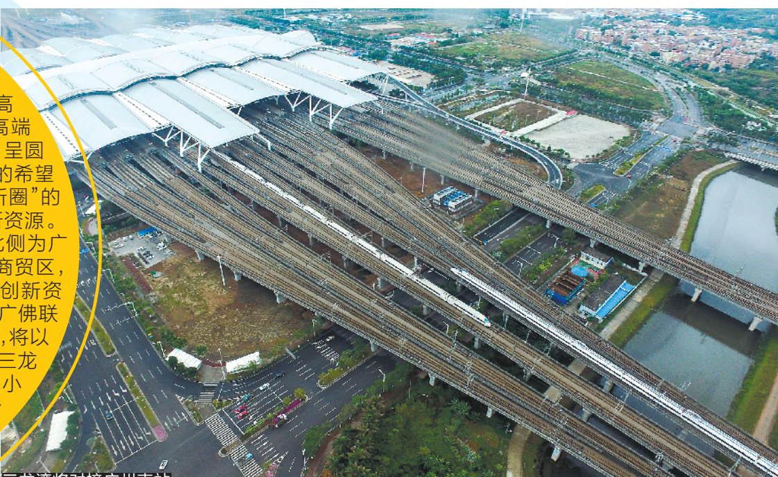
三龙湾将对接广州南站

广佛之间一座新的创新高地正在强势启航。2017年9月,佛山首次提出在禅城、南海、顺德三区打造禅南顺高端创新集聚区,后被正式命名为“三龙湾高端创新集聚区”。这是佛山“家底”最厚的区域,呈圆弧形与广州的荔湾、番禺和南沙相连。佛山的希望是,打造佛山版的松山湖,并且作为“一环创新圈”的龙头片区,全面对接广州、深圳外溢的科技创新资源。不谋而合的是,三龙湾高端创新集聚区北侧为广州荔湾国际科技创新产业区,东侧为广州南站商务区,东南侧为广州城市副中心、广东南沙自贸区,创新资源集聚。随着佛山三龙湾规划建设提上日程,广佛联动迎来许多新设想。今年,广佛两市初步商定,将以广州南站为核心,打造广佛合作试验区。与三龙湾紧密联结的荔湾、番禺、南沙“广州三小龙”,也将在与佛山原合作基础上,结合粤港澳大湾区建设,拉开进阶版互惠互利序幕。