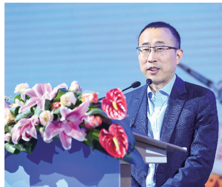
蒙牛集团总裁卢敏放先生于“健康中国营养+联盟”启动会上进行“健康中国企业社会责任”主题演讲

识，为益生菌生产和应用提供了规范和标准。作为强有力的专业指导意见，将为推动和促进我国低温乳制品产业可持续发展提供科学保障。