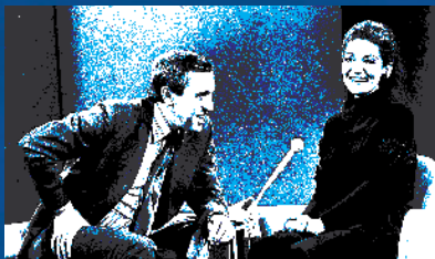
纪录片使用了大量玛丽亚·卡拉斯的珍贵影像