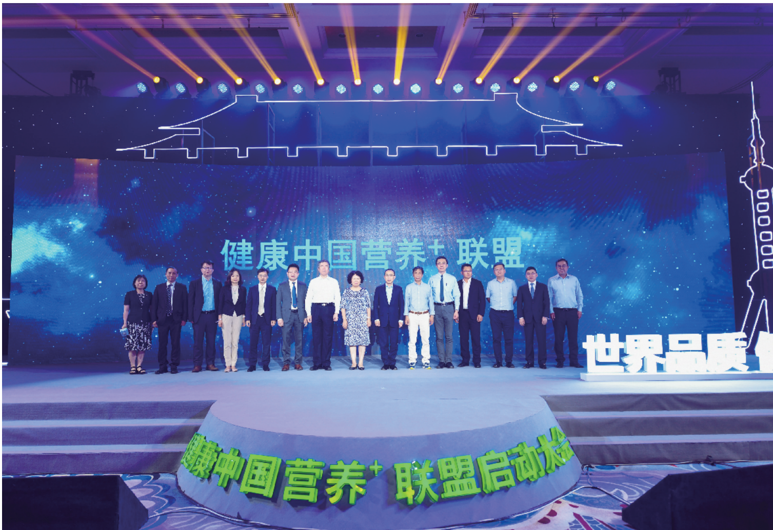
中国营养学会携手蒙牛集团及到场嘉宾共同开启“健康中国营养+联盟”启动仪式

2019年5月29日，正值世界肠道健康日之际，为贯彻落实《“健康中国2030”规划纲要》，提高国民营养健康水平，由中国营养学会主办，蒙牛乳业承办的“健康中国营养+联盟”启动仪式在北京举行。来自“健康中国营养+联盟”主办方中国营养学会、承办单位蒙牛乳业以及中国营养学会益生菌益生元分会、内蒙古农业大学、北京协和医院、今日头条等机构的代表出席本次活动。国家工信部消费品司、中国乳制品工业协会和中国保健协会的领导到场并对联盟成立表示祝贺。