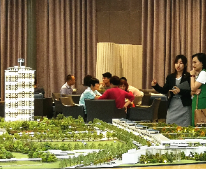
上周末,朱村一带的楼盘现场人气很旺

开放销售中心,“邻居”保利中海金地大国璟正整饰园林和样板房,预计近期开放,这两大新盘将是近期朱村板块的最大亮点。 新盘新货陆续推售,产品同质化严重,竞争将会非常激烈。各个楼盘都有不少80-120平方米的单位,刚需购房者选择非常丰富。