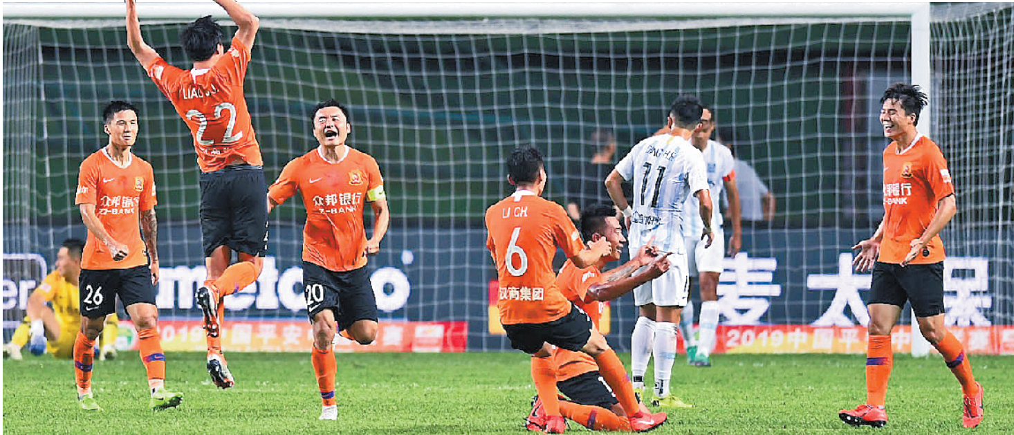
武汉卓尔球员欢呼图

羊城晚报讯 记者苏苒报道：扎哈维在越秀山体育场上演帽子戏法，可惜他的努力被“黑色五分钟”断送——广州富力昨晚在下半场被“升班马”武汉卓尔连入三球，最终以3比4落败，遭遇本赛季中超联赛的主场首场败仗。