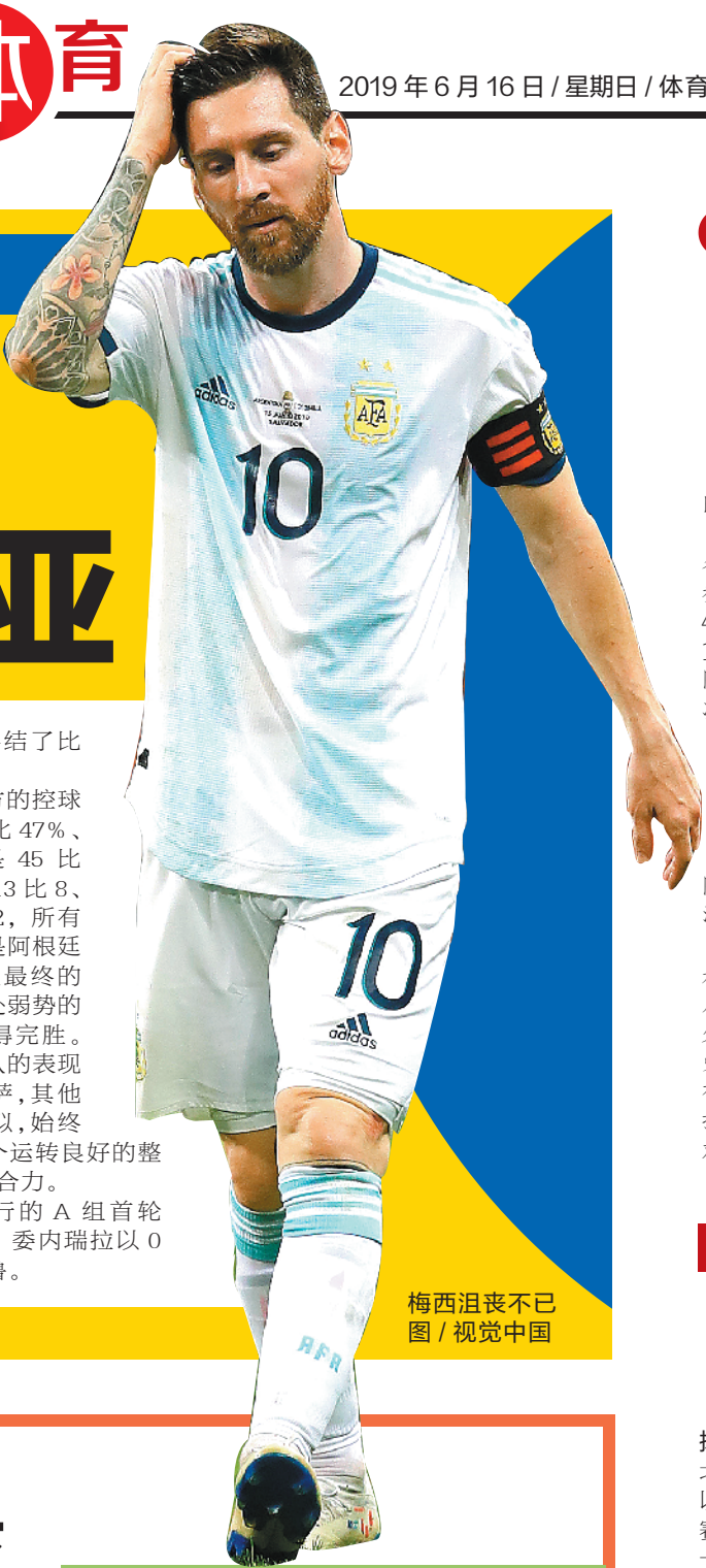
梅西沮丧不已图