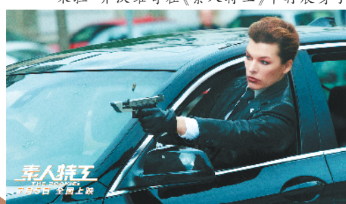
米拉·乔沃维奇在《素人特工》中再展身手