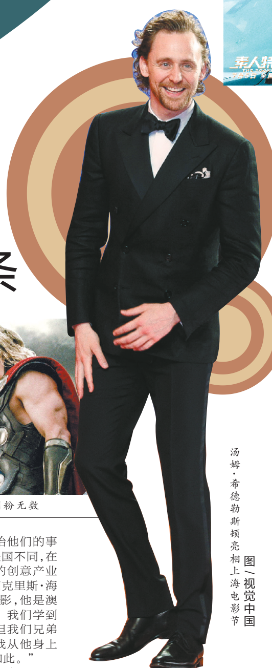
羊城晚报记者 邵梓恒