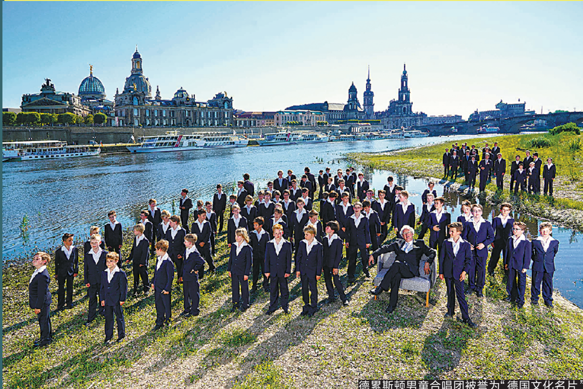
德累斯顿男童合唱团被誉为“德国文化名片”

除了“合家欢”亲子场，即将亮相的演出还有不少：由《溱心风暴》原班人马打造的舞台剧《秘密》，看港剧长大的老广们不容错过；《盗墓笔记》全新番外篇《新月饭店》也让“稻米”们翘首以待；法国音乐人洛朗·班的live巡回演唱会则等着广州的法语歌迷们一起疯狂。