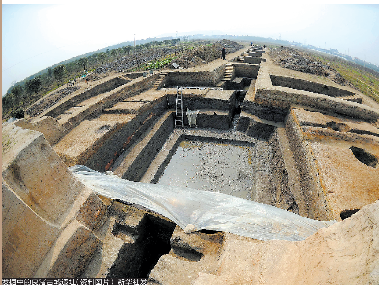
发掘中的良渚古城遗址（资料图片）