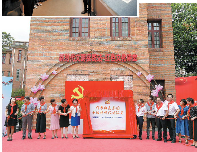
越秀區青少年紅色研學活動啟動