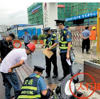
执法人员勘察现场

最后,依据上述条例以及《深圳市交通运输行政处罚量标准》的规定,执法人员对建设单位和项目负责人分别开具违法通知书,拟对建设单位处 10 万元罚款,对项目负责人处 5000 元罚款。