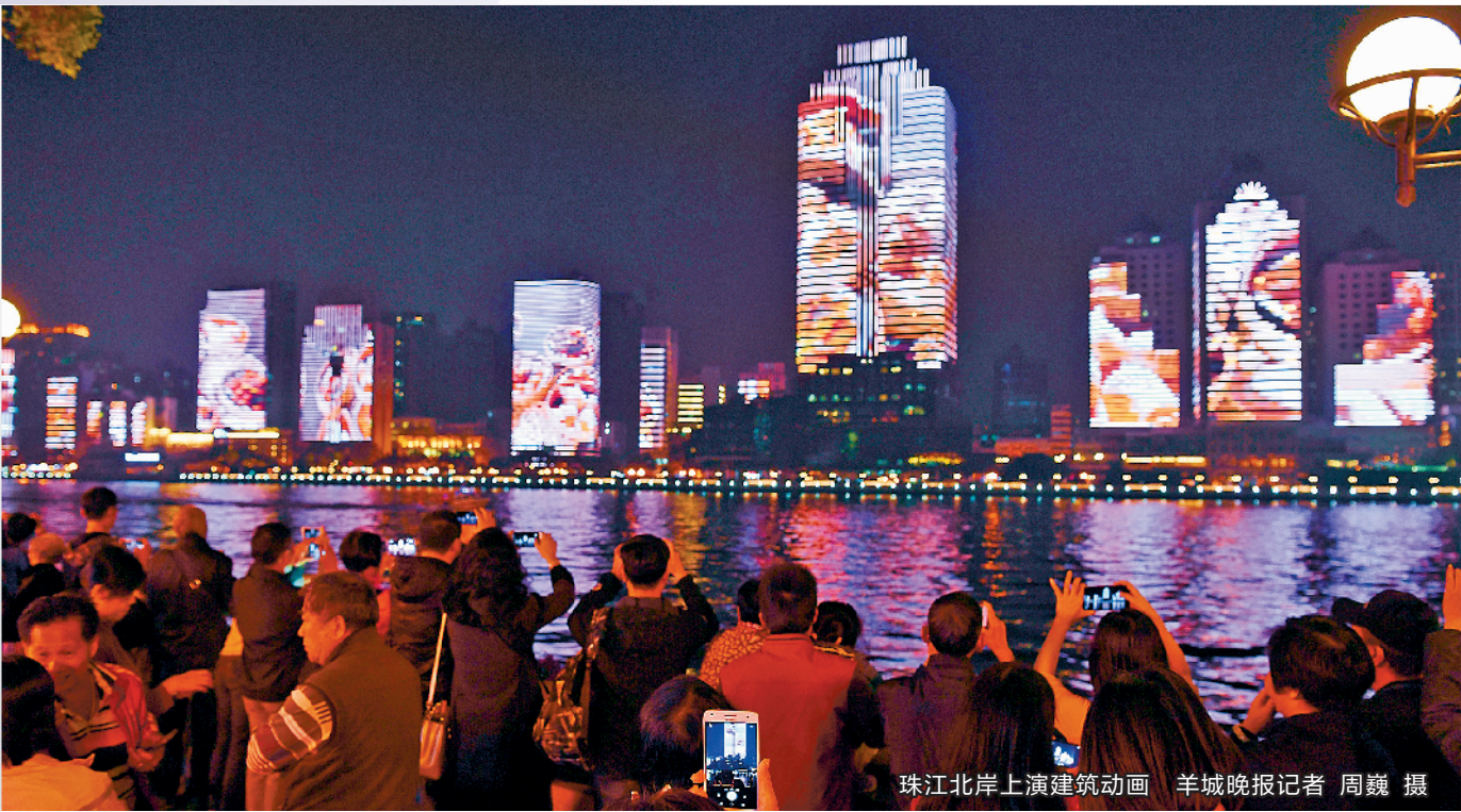
珠江北岸上演建筑动画

夜生活折射时代之变，凸显人们对美好生活的新需求。记者调查发现，用改革的方法扩大夜消费，从供给侧结构性改革发力，将充分释放“夜经济”活力，创造健康、时尚、美好的夜生活。