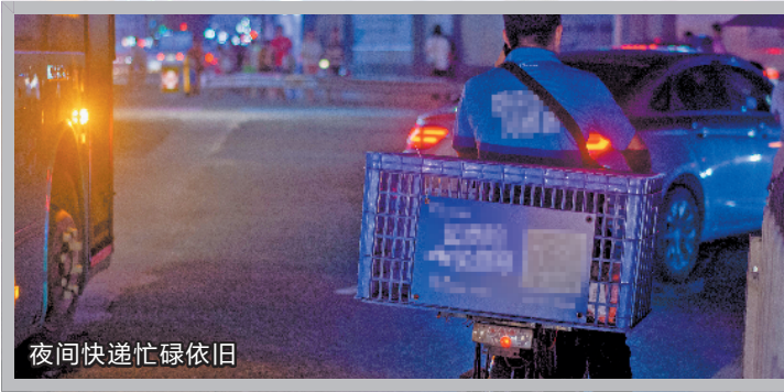
夜间快递忙碌依旧