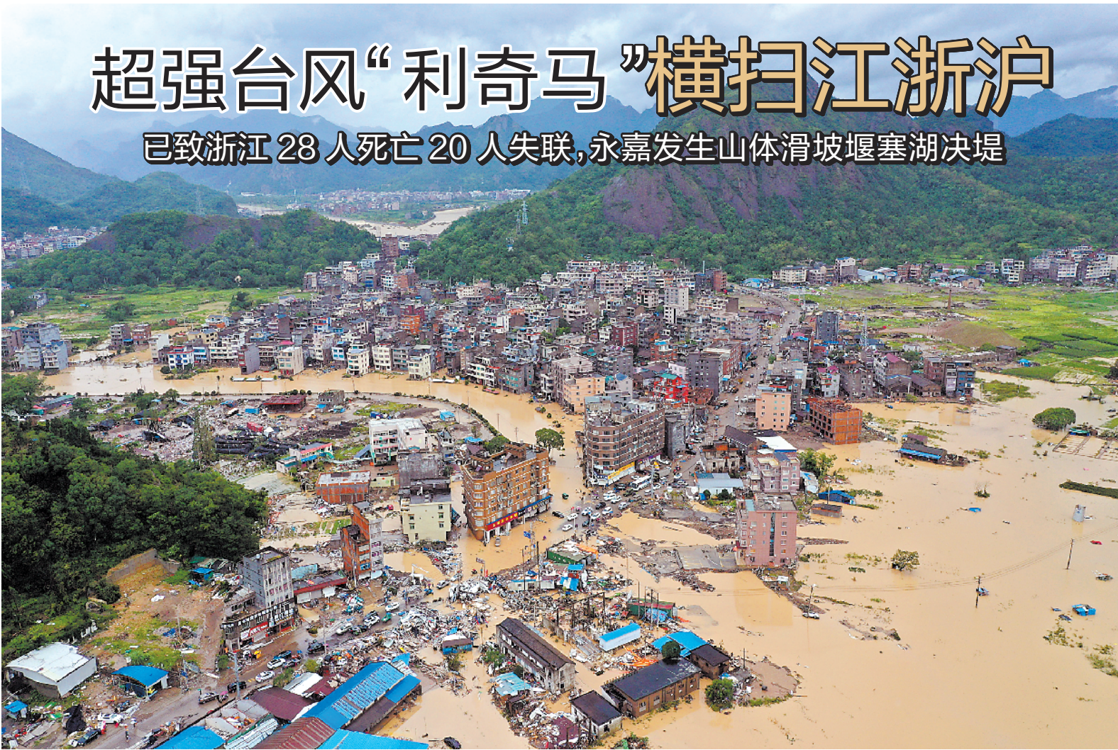
超强台风“利奇马”横扫江浙沪 已致浙江28人死亡20人失联,永嘉发生山体滑坡堰塞湖决堤

“利奇马”携风裹雨,威力惊人,登陆时中心附近最大风力16级(52米/秒),成为今年以来登陆我国强度最强的台风。据浙江省防指介绍,这次台风带来的主要影响:一是强度大、雨量大;二是水库河网度汛压力大;三是各地受灾严重;四是电力通信交通等基础设施破坏严重。