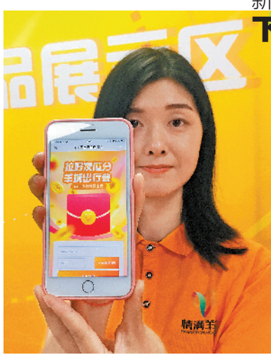
羊城出行金分单领取页面

羊城晚报讯 记者陈泽云报道:过期药属于什么垃圾,你知道吗?根据2016年新版的《国家危险废物名录》中,家庭过期药品被明确纳入其中,在垃圾分类中,过期药品应被分类到“有害垃圾”。记者昨日从广药集团获悉,自8月13日至31日期间,广药白云山将在全国各授权的更换点进行家庭过期药品的回收,广州等地的居民可凭身份证按《换药目录》中的品种1:1比例更换新批号产品,从而助力有害垃圾回收。据悉,全国可上门回收过期药品的城市从去年17个增加到今年的32个(北京、广州、天津、深圳、南京、西安、苏州、杭州、郑州、成都、重庆、石家庄、沈阳、合肥、济南、宁波、无锡、太原、长沙、南昌、昆明、长春、吉林、临沂、佛山、厦门、齐齐哈尔、大连、青岛、绍兴、哈尔滨)。