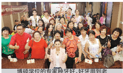
博硕士学位的专家种牙好,好牙用到老