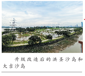
升级改造后的洪圣沙岛和大吉沙岛

洪圣沙岛和大吉沙岛位于珠江口,西临长洲岛,对望黄埔港。近年来,越来越多的市民上岛“打卡”,高峰期一天超2000人上岛。“网红岛”的名称逐渐在广州市民中传播开来。