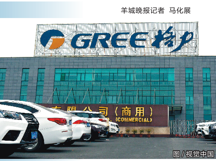
羊城晚报记者 马化展

牵手格力不是件容易的事，格力开出“相亲”条件。8月12日晚上，格力电器(000651)发布公告称，格力集团股份转让价格不低于45.67元/股，即总价起码近400亿元。同时提出受让方还要有能力为上市公司引入有效的技术、市场及产业协同等战略资源在内的条件。