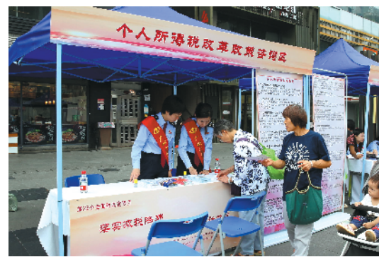
要让减税降费政策家喻户晓落地见效

据了解，在大力开展税费政策宣传的基础上，税务部门还将继续围绕减税降费主题，不断出台落实举措，创新服务手段，推动减税降费落地见效。