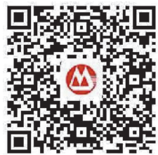
扫码免费办理 招行 ETC

一直以来，招商银行秉承“因您而变”的服务理念，聚焦用户体验，深耕服务场景，致力于为客户提供优质、高效、便捷的服务。未来，该行将继续借力科技，不断创新，为羊城智慧出行再添新色彩。(戴曼曼)