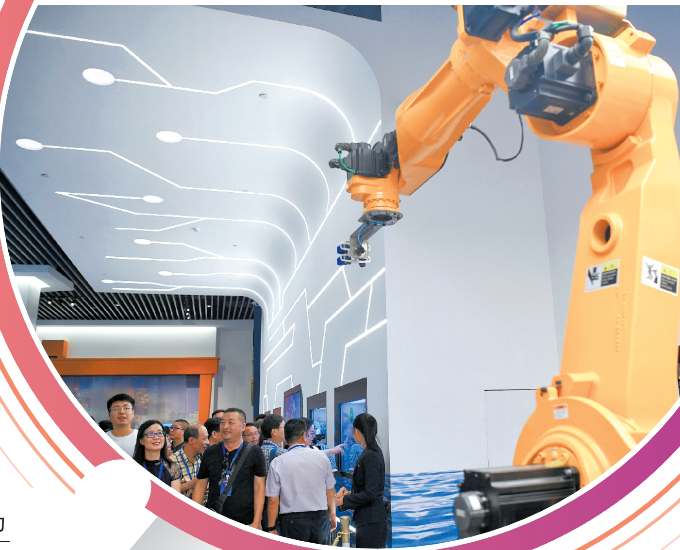
社长总编们参观科学广场综合展示厅