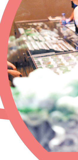
水贝是当之无愧的“中国宝都”

四天活动圆满结束后，百位社长总编依依惜别，纷纷表示此行印象深刻，今后将持续关注大湾区的发展。