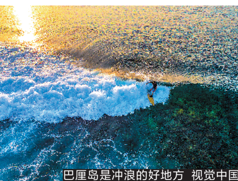
巴厘岛是冲浪的好地方

巴厘岛是印度尼西亚最受游客欢迎的旅游目的地,素有“世外桃源”之称。游客到巴厘岛只有一个目的,那就是体验“叹世界”。