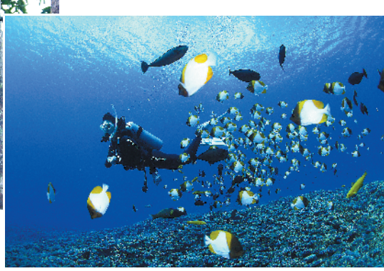
塞班岛拥有得天独厚的潜水资源