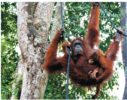
古晋SEMENGGON野生动物保护中心的红毛猩猩

此外,马来西亚沙捞越州的首府古晋也值得一去,一般游客或者并不熟悉,它聚居的华人众多。最令人神往的地方是巴哥国家公园。国宝级的动植物,如长鼻猴、银叶猴、白颌翡翠、和平鸟、猪龙草、毛毡苔……足以让巴哥闻名世界。巴哥还有七种生态不同的森林以及奇形怪状的沙岩、壮观险峻的悬崖、幽美诱人的沙滩等景观。 交通: 广州可直飞沙巴州。