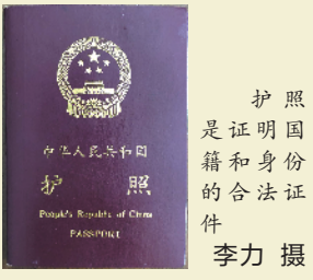
护照是证明国籍和身份的合法证件

综上所述,“白本”护照出境游签证攻略就是:东南亚—韩国/新加坡/澳洲—日本—申根—美国—世界各地!