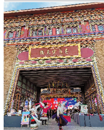
独克宗花巷每晚上演香格里拉风物集市