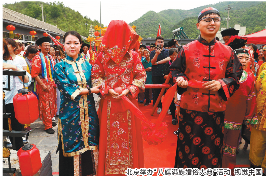
北京举办“八旗满族婚俗大典”活动

本期，旅游周刊为你筛选了几处各具特色的上榜村庄。选一个周末或节假日，带上家人、朋友，前往一处乡村徒步露营、吃农家饭、住民宿客栈、采摘新鲜蔬果，其乐无穷。