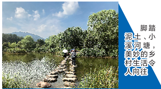
脚踏泥土、小溪河塘，美妙的乡村生活令人向往

于今年上半年以来，哪些城市的游客对乡村旅游的热情最高?途牛旅游网监测数据显示，位居前列的十大乡村旅游客源城市依次为：上海、北京、南京、天津、深圳、杭州、成都、广州、苏州、武汉。