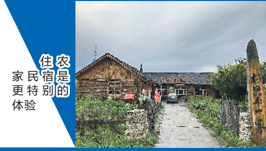
住农是更特别的体验