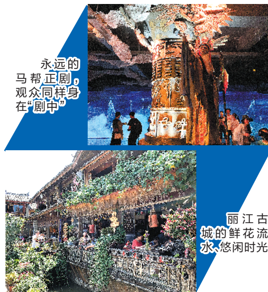
永远的马帮正剧，观众同样身在“剧中”