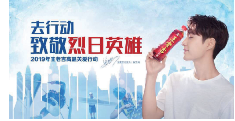
2019年王老吉高温关爱行动