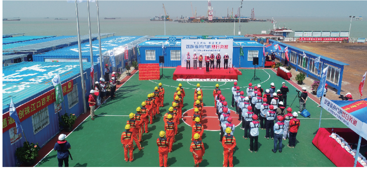
“致敬新时代的烈日英雄”活动现场