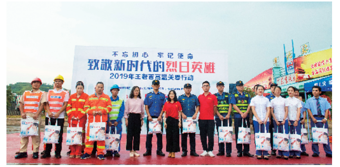
为“烈日英雄”送清凉礼包和凉茶