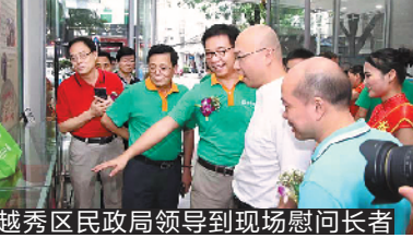
越秀区民政局领导到现场慰问长者