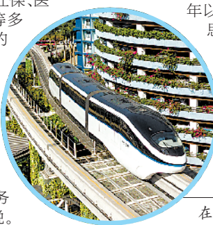
在位于深圳的比亚迪总部，“云轨”列车在运行调试中

使命呼唤担当，使命引领未来。广东因改革开放而生，因改革开放而兴。站在新的历史起点上，广东必将担当好“先行示范”的历史使命，在建设中国特色社会主义先行示范区的征程上加速前行。（文/图 新华社）