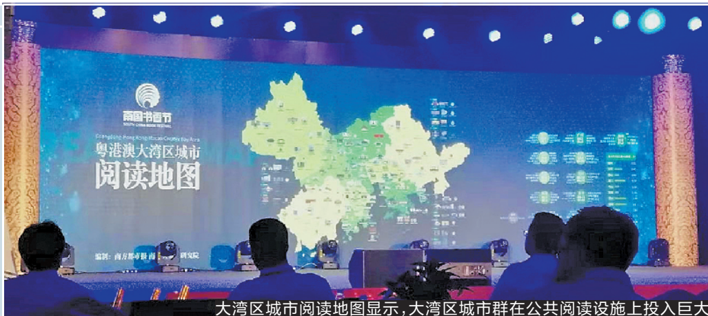
大湾区城市阅读地图显示，大湾区城市群在公共阅读设施上投入巨大

20 日的“2019 南国书香节阅读盛典”上，还发布了“粤港澳大湾区城市阅读地图”。