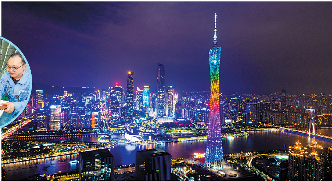
炫彩广州塔与珠江新城璀璨灯火交相辉映