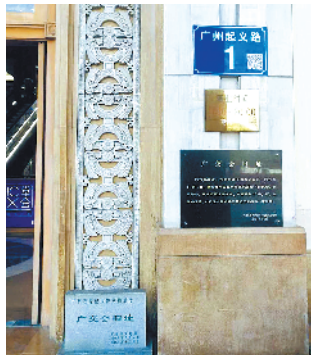
海珠广场旁的缤缤广场其实是广交会馆旧址

历史文化地标： 海珠广场雕像、广交会馆旧址 本土文化延展： 哥特式教堂，骑楼建筑文化，十三行盛景历史，海味一条街，文具玩具批发市场，食品行棧 商圈消费特色： 批发经济 透视生活百态