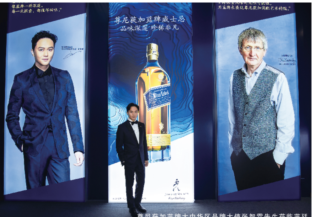
尊尼获加蓝牌大中华区品牌大使张智霖先生莅临蓝廷