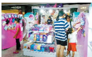
开学在即，不少家长带着小朋友来此买文具

“嫁女不是买豆沙馅的！”一声亲切地道的粤语从一德路上一家老字号饼铺柜台里飘出，充满人情味的老广州生活气息弥漫开来。