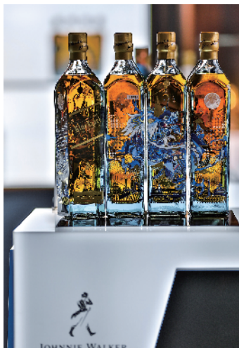
尊尼获加蓝牌限量版“祥瑞麒麟”为中秋送祥瑞美好祝福

2019年8月17日，著名苏格兰威士忌品牌尊尼获加(Johnnie Walker)独家打造的沉浸式