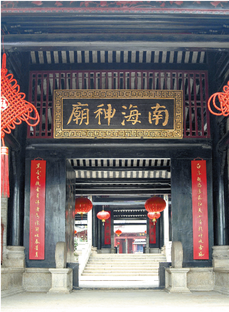
▲南海神庙图

■美国研究人员研制出一种会变焦的电子隐形眼镜,能够随佩戴者的眼部动作自动聚焦远处或近处的物体。研究人员认为,这项新技术有利于近视又老花的人视物。