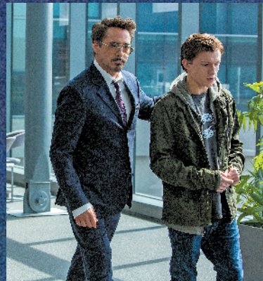
钢铁侠与蜘蛛侠情同父子

2015年,索尼和漫威正式达成协议,两个电影宇宙得以共同享有蜘蛛侠,并进行有限的互动。因此,汤姆·霍兰德扮演的蜘蛛侠才得以出现在漫威的《美国队长3》以及《复仇者联盟》第三部、第四部中。