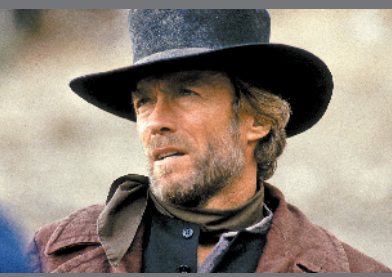
早年的牛仔形象深入人心

由奥斯卡金像奖导演克林特·伊斯特伍德自导自演的犯罪悬疑片《骡子》,即将于8月26日登陆全国艺联专线。对于影迷来说,这是又一次膜拜伊斯特伍德生命力和创造力的时刻。要知道,这位宝藏老爷爷出生于1930年,今年已经89岁了!