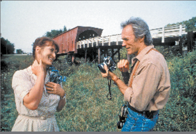
主演《廊桥遗梦》为中国观众所熟悉