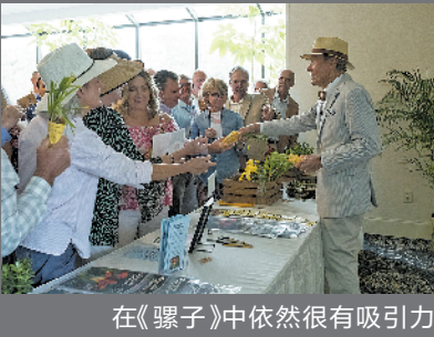
在《骡子》中依然很有吸引力