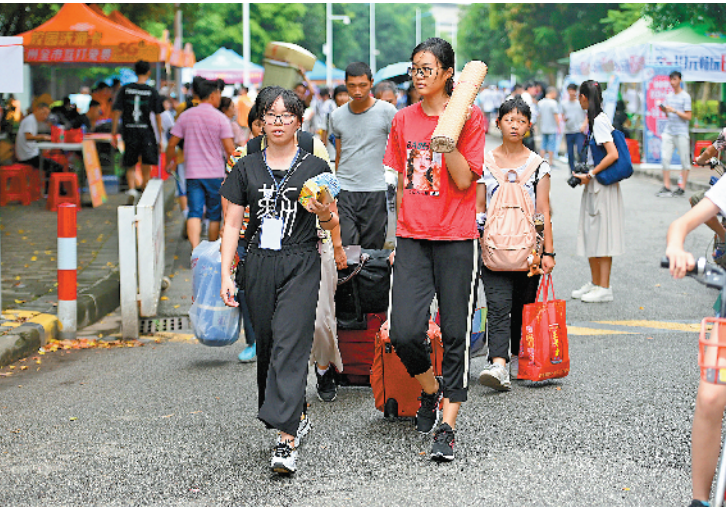
广州大学“迎新”