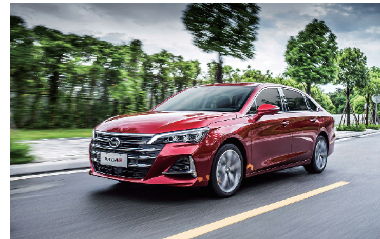
全新一代 传祺 GA6

不忘初心，逐梦而行。对于广汽传祺而言，全新一代传祺 GA6 并不只是一款新车，它还承载着广汽传祺“敢梦想、勇担当、恒进取”的品牌价值观，传递着广汽传祺品牌向上的精髓。对于广大消费者来说，它意味着更加触手可及的智能愉悦移动生活，展示着蓄势腾飞的中国力量，树立中国品牌中高级轿车的新标杆。