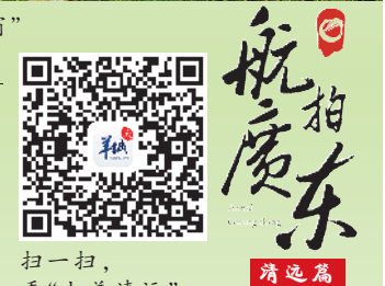
扫一扫，看“大美清远”

如今，清远以深化广清一体化为抓手，全面对接粤港澳大湾区，带动全市区域协调发展。清远以交通互通为先导，完善推进广清交通一体化，加快融入大湾区1小时经济生活圈，加快打造粤东西北“融湾”先行市。